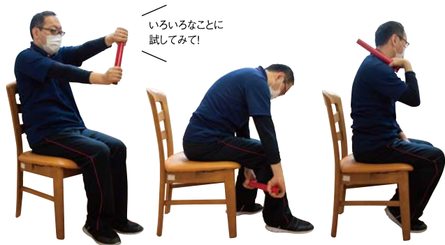
いろいろなことに試してみてください!