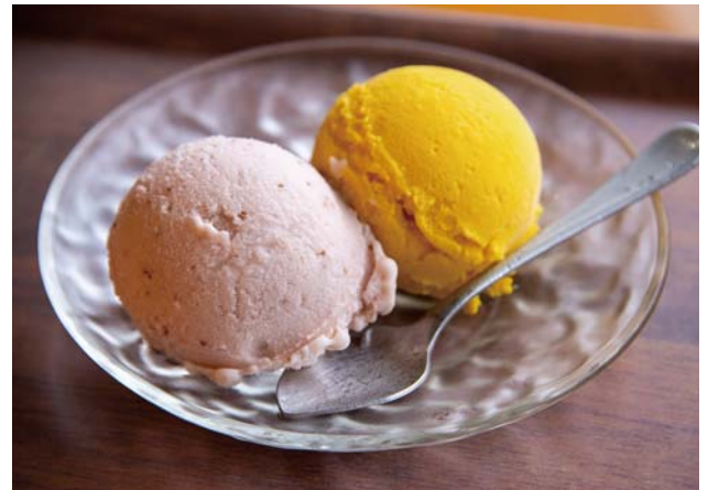
人気の完熟いちごとカボチャ。夏はさっぱりしたニューサマーオレンジもおすすめ。

三島駅近く、地産地消がコンセプトのジェラートとプリンのお店。コクのある丹那牛乳や三島産の果実や野菜を中心に、地元食材を使ったジェラートが10種類前後並びます。利用者と職員が心を込めて作る人気のプリンは卵の味が濃く、カラメル別添えだから子どもも安心。手土産にもぴったりです。